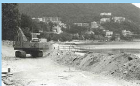
政府進行改善工程，取締有關的排水渠，並把受污染的雨水引離泳灘以改善環境。