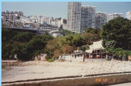
泳灘曾有一條礙眼的排水渠把污水引到泳灘範圍。